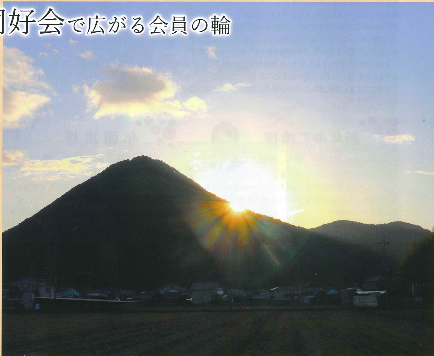
場 所：野洲市三上