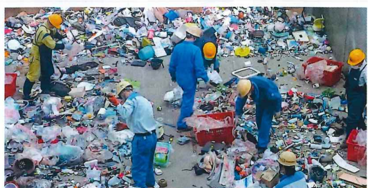
不燃ゴミの選別作業