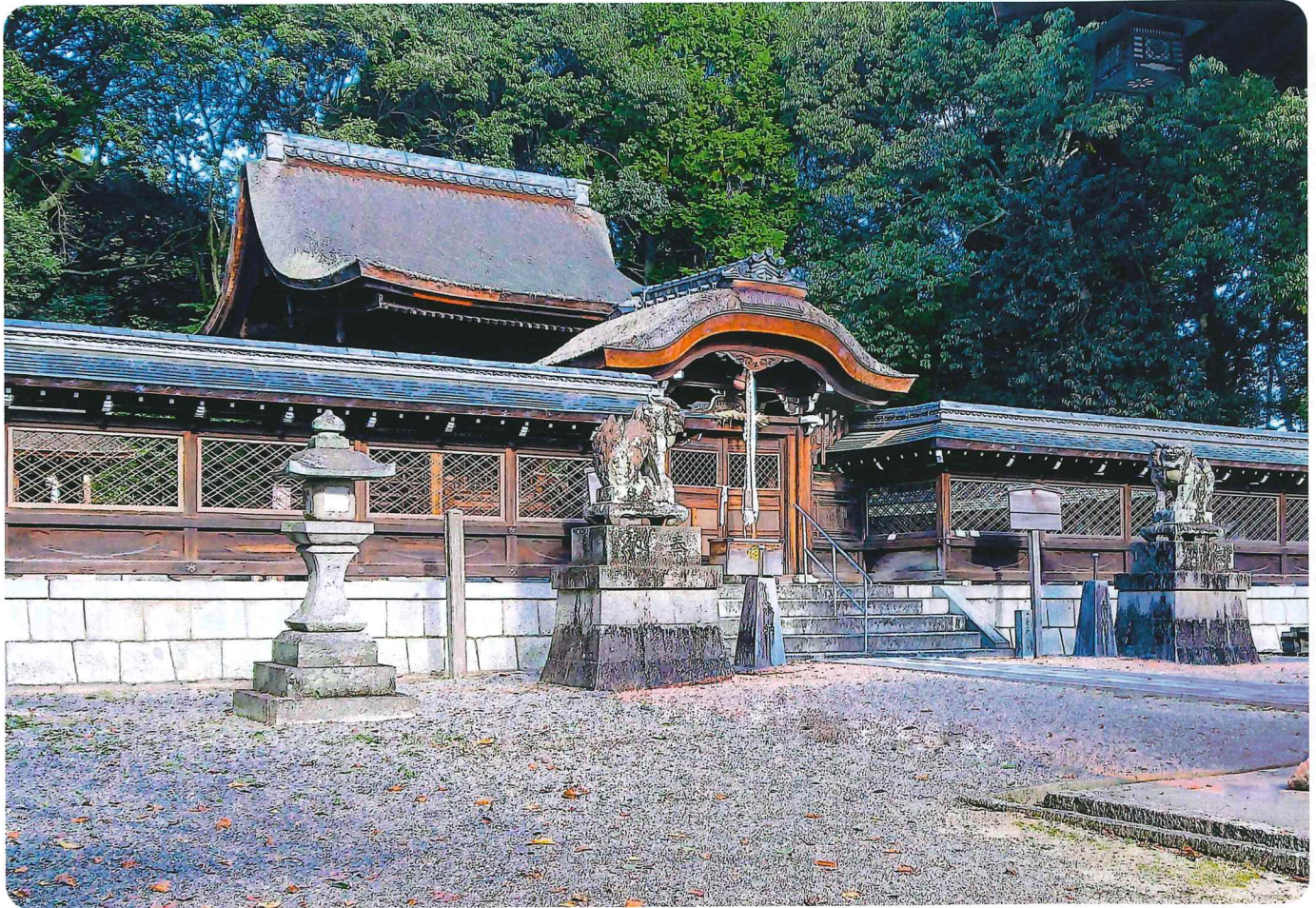
〔生和神社〕：兵主9班 吉川 健一