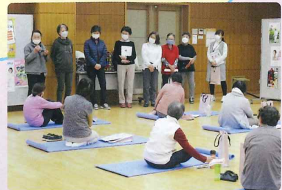
女性部会員からの体験談