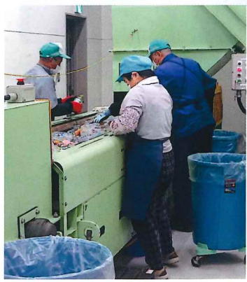
ペットボトル仕分け作業