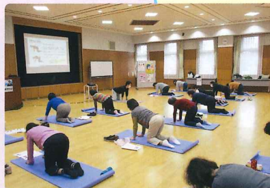
エクササイズ実施風景