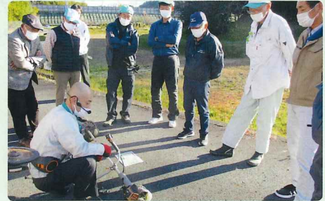
メンテナンス方法の講義