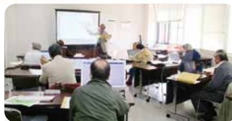
パソコン講座の様子