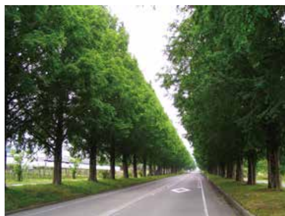
『メタセコイア並木』