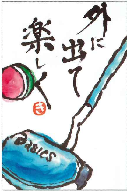
絵手紙 野洲三班 丹羽 きよ