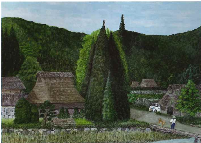
『里』 絵画 祇三班 西井 貞夫