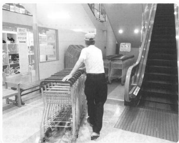
アル・プラザ野洲カート・カゴ整理