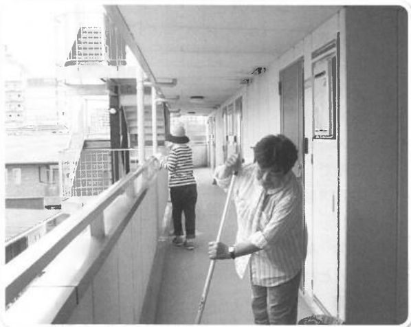
マンション清掃作業