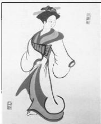
大津絵「太夫(白無垢美人)」