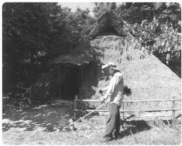
弥生の森公園管理