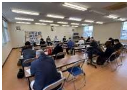
入会説明会の様子