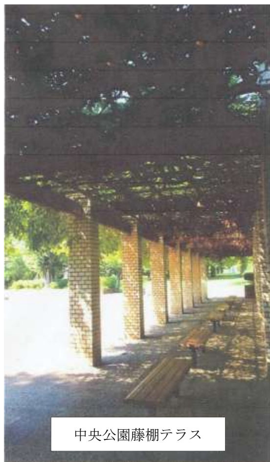
中央公園藤棚テラス

まさに市民、特に私たちシルバー世代の憩いの場とも言えるこの公園は八街総合病院の近くにあります。無料の駐車場もありますので会員の皆さま、一度訪れてみてはいかがでしょうか。