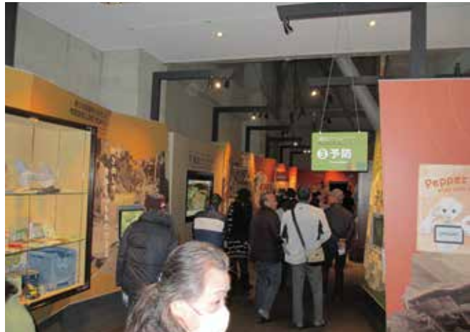
「稲むらの火の館」を見学し、 防災の意識を新たにしました。

JR宇治駅からバスに乗車し、和歌山県広川町にある「稲むらの火の館」を見学し、江戸時代の南海地震による大津波から村人を守った歴史に触れ防災の大切さを認識しました。