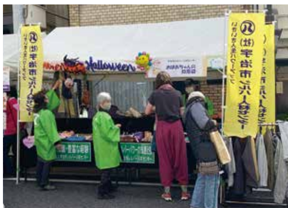
宇治橋通り商店街「わんさかフェスタ」で活躍するなでしこの会のメンバー

今後、ズボン・スカートなどの寸法直しを企画しています。代金は1,000円～1,500円くらいを目安にしています。ご希望の方はセンターまで持ち込みをお願いします。