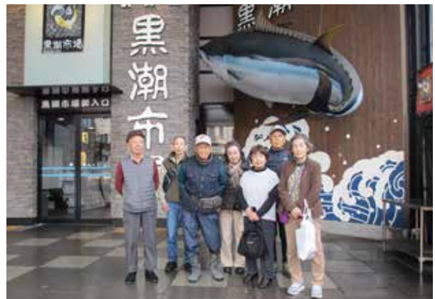
黒潮市場でお買い物の後、 宇治市から参加の皆さんで記念撮影