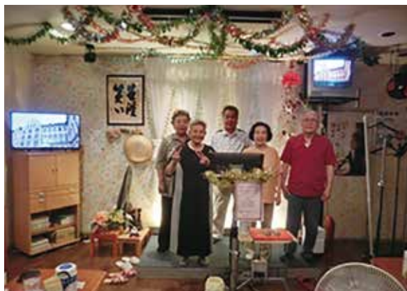
宇治ろまん活動の様子