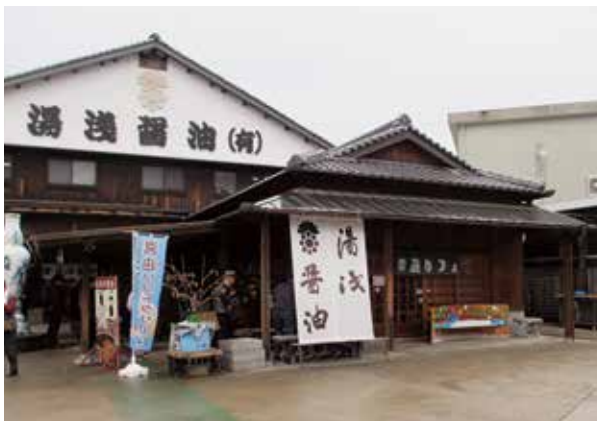
湯浅町の醤油蔵で、食卓に欠かすことのできない 醤油づくりの工程などを見学しました。

午後には、日本醤油発祥の地と言われている湯浅町の湯浅醤油蔵で醤油製造の工程などを見学しました。最後に黒潮市場に立ち寄り、海産物などのお土産を買って帰路につきました。道路事情などにより予定より遅い帰着となってしまいましたが、見どころの多い旅でした。