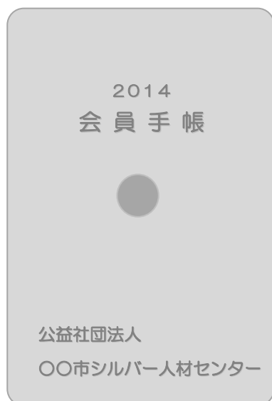
(2014年版会員手帳名入れ版イメージ)

全シ協では、シルバー人材センター事業を円滑に運営・推進していただく一助として、手引書、冊子などの頒布物を発行しています。