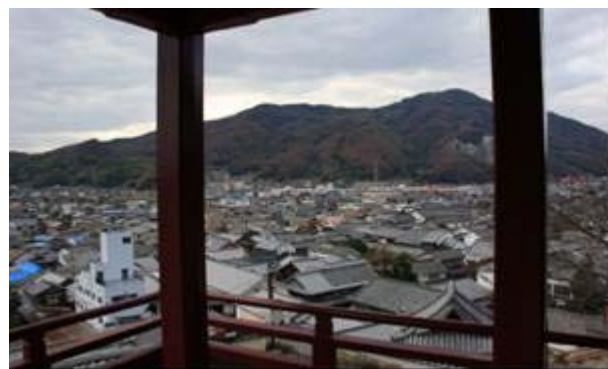
普明閣より町並みを望む