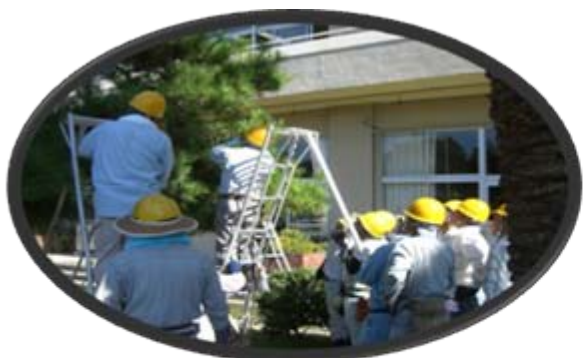
剪定講習会(平成25年5月16日)