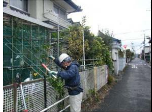
東近江市 伐採作業