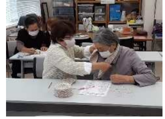
自宅、受付での検温、マスクの着用、除菌等感染予防対策を行って開催しました。

11月23日カミーノで行われた「手をつなぐマルシェ」に手芸サークル「花みずき」が出店しました。あいにくのお天気で外での開催は出来なくなりましたが、カミーノ内は、多くの方にぎわっていました。花みずきの手作り作品も多くの方にご覧いただくことができました。