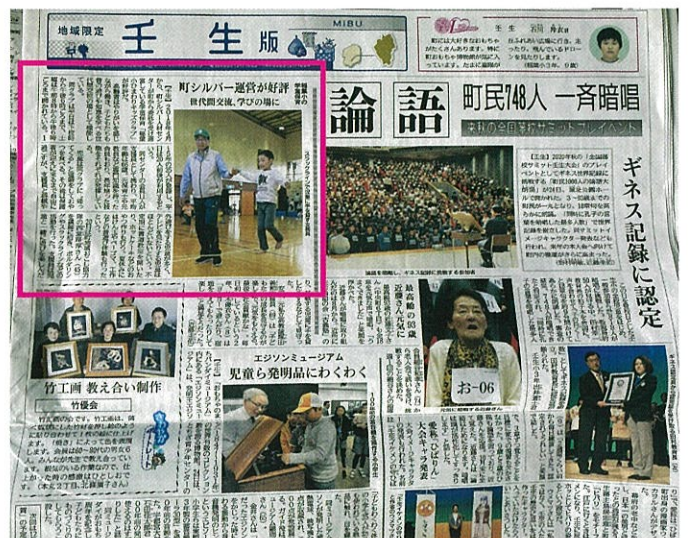
下野新聞 令和元年11月25日 壬生版の中に2番目に大きく掲載されていました