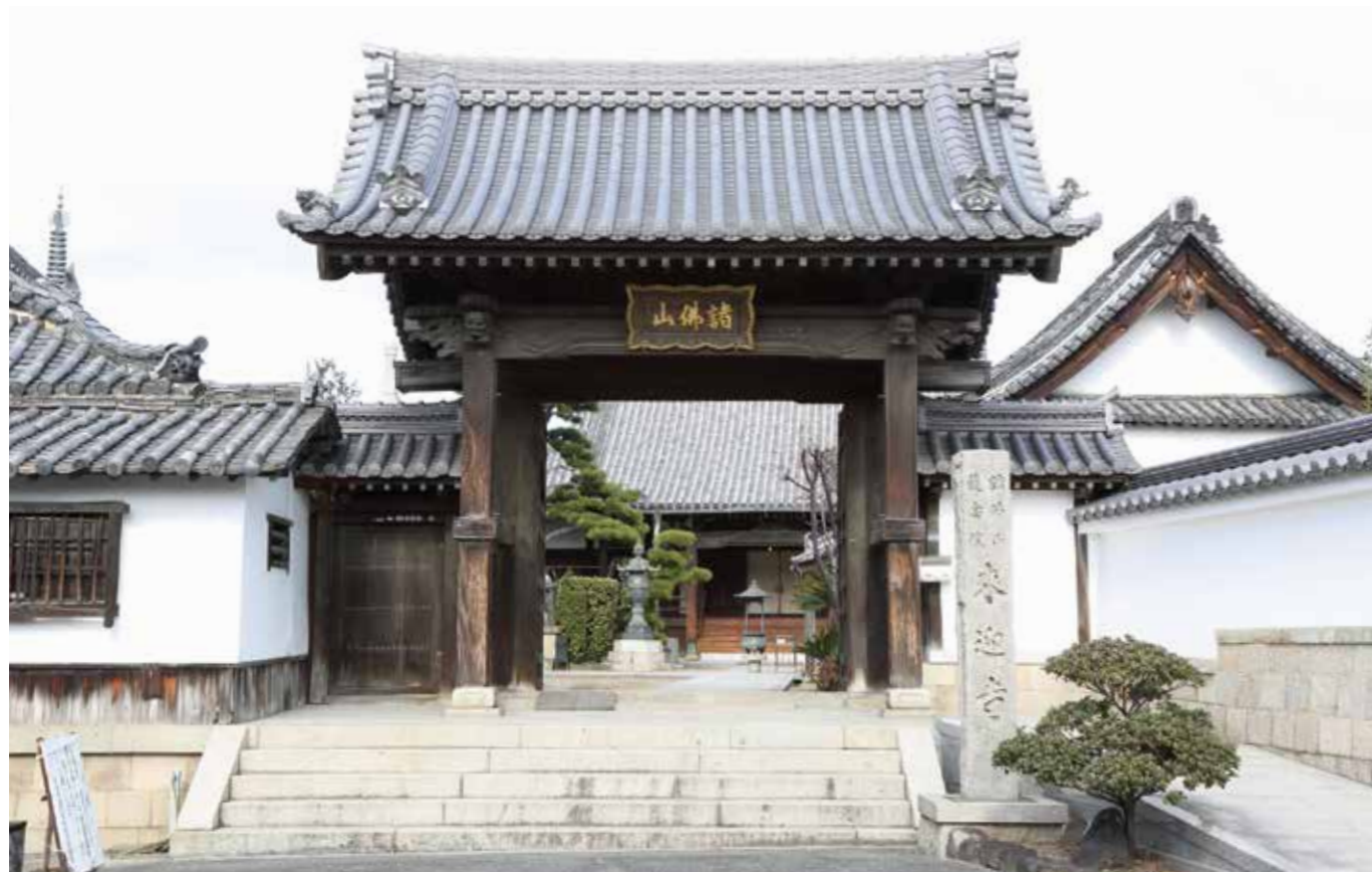
来迎寺 (丹南3丁目) (出典:まつばら文化財デジタルアーカイブより)

第101号 (公社) 松原市シルバー人材センター 発行 〒580-0043 松原市阿保1丁目1番1号 松原市役所内 TEL (072) 337-1141 インターネットの公式サイトは