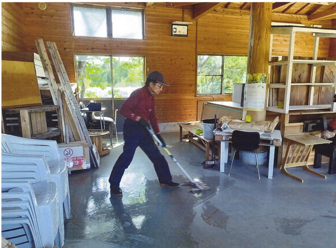
フリージアまつり会場東屋の清掃

令和8年4月1日現在 ● 八丈町の60歳以上人口 男性 1,433名 女性 1,643名 計 3,076名 ● シルバー人材センター会員 男性 134名 女性 117名 計 251名