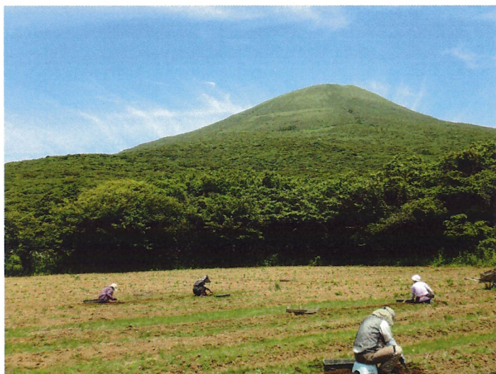
フリージア畑の球根掘り