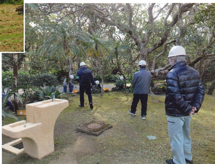
清掃作業の安全就業巡回指導