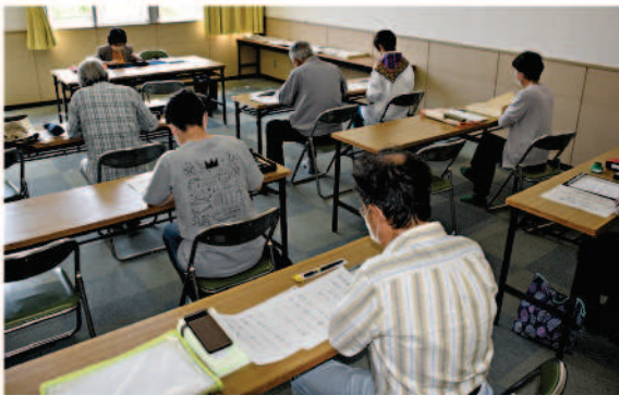
毛筆・ペン講習会

シルバー人材センターでは、60歳以上の町民の方にもご参加いただける講習会を開催しています。開催日などは、ホームページ、及び町の広報無線でお知らせいたします。