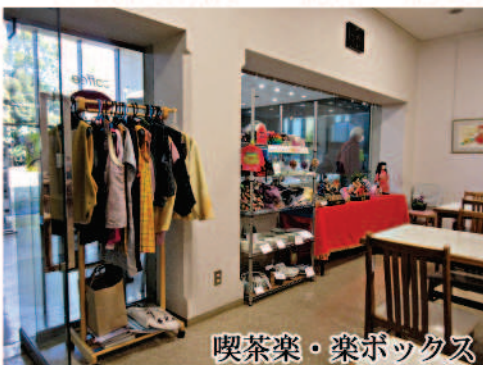
喫茶楽・楽ボックス