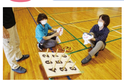
ゲームの合間に消毒作業