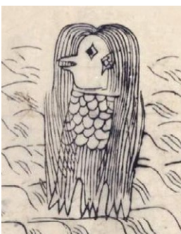
疫病除けで話題の妖怪「アマビエ」

左の絵は日本に伝わる妖怪「アマビエ」です。疫病や豊作を予言して自分の姿を描き写して人々に見せると難を逃れるという言い伝えから話題となりました。奇妙な姿ですがどこかなくかわいらしい「アマビエ」。お守り代わりにイラストを持ち歩くのも良いかもしれません。(事務局)