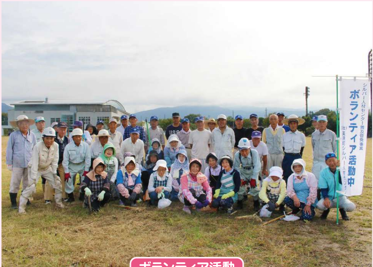
ボランティア活動

発行日 令和 2 年 1 月 発行所 公益社団法人 美浜町 シルバー人材センター 編 集 総務部会