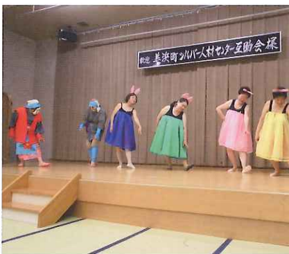
楽しかった宴会の様子

12月3日には、交流輪投げ大会が行われました。簡単なようで結構難しい集中力のいる競技でした。互助会では、このように楽しいことを企画し会員自ら楽しんでいきます。残るお楽しみは、平成27年3月に行われますゲートボール大会です。今から楽しみにしています。会員資格は、1,000円払えばだれでも入会できますのでいかがでしょうか。