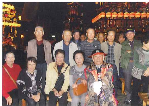
高山祭りミュージアム

互助会の活動の様子をお知らせいたします。11月11日から12日にかけて下呂方面へ旅行に行きました。天気も良くお酒もおいしくワイワイにぎやかな楽しいバス旅行でした。