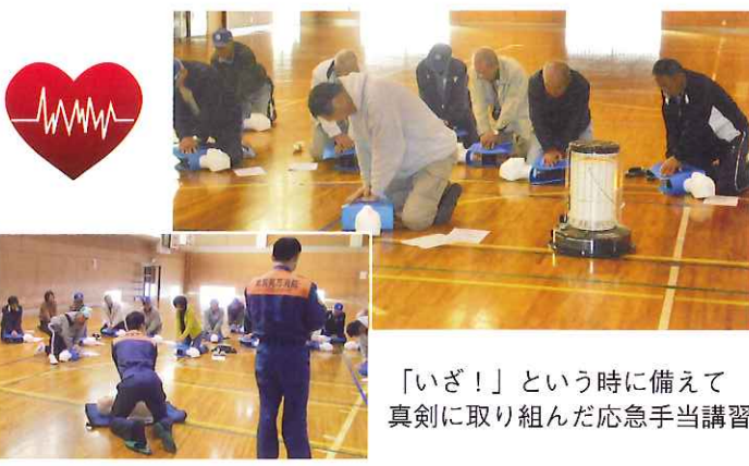
「いざ!」という時に備えて真剣に取り組んだ応急手当講習会