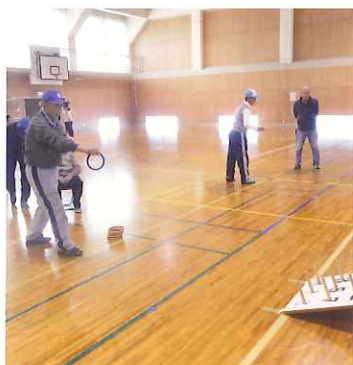
12月3日輪投げ大会の様子

12月3日には、交流輪投げ大会が行われました。簡単なようで結構難しい集中力のいる競技でした。互助会では、このように楽しいことを企画し会員自ら楽しんでいきます。残るお楽しみは、平成27年3月に行われますゲートボール大会です。今から楽しみにしています。会員資格は、1,000円払えばだれでも入会できますのでいかがでしょうか。