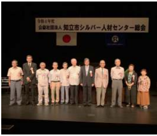
▲岩堀会長（中央）と出席された顕彰者の皆さん