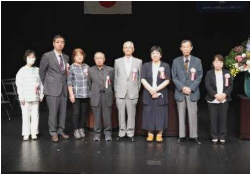
▲出席された顕彰者の皆さん