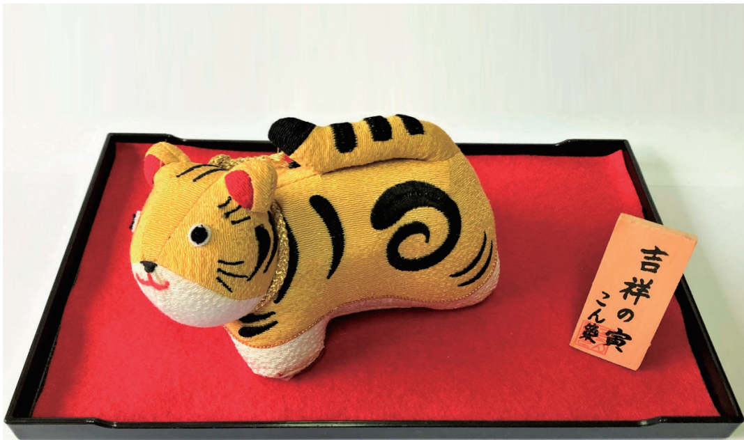
なでしこの会の作品「吉祥の寅」

新年明けましておめでとうございませう。 会員の皆様におかれましては、ご家族お揃いで佳き新春をお迎えのことと心からお慶び申し上げます。