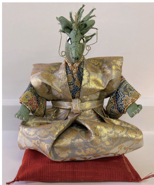
「なでしこの会」作品

5月8日以降は、事業の実施や感染対策は、法律に基づき行政が様々な要請・関与をしていく仕組みから、個人の選択を尊重し、自主的な取組をベースとした対応を行うことになりました。その結果、様子をうかがいながらではありますが、多くの事業を復活することができました。この間の会員の皆さまのご尽力には心より感謝しております。