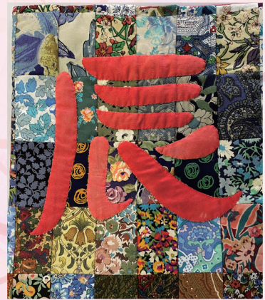
なてしこの会 作品

また、「たつ」は、四神（青竜、朱雀、白虎、玄武）のひとつで、水中に棲むとされ、なき声で嵐や雷雲を呼び、竜巻となって昇天し飛翔します。豪雨などによる災害がなく、今年一年が穏やかで安全な年であることを願っています。今年もよろしくお願ひします。（H）