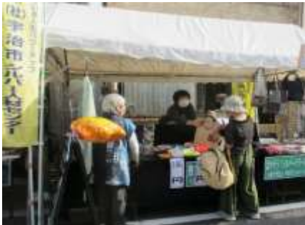
活躍するなでしこの会

10月22日(土) 好天のもと宇治橋通り商店街で「笑顔いっぱいわんさかフェスタ」が3年ぶりに開催されました。