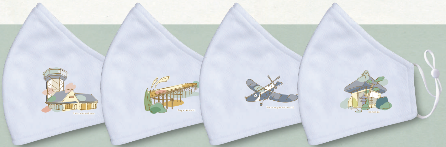
三川合流 「さくらであい館」