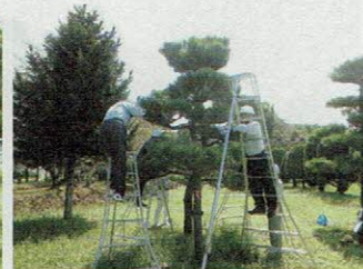
▲植木剪定初心者講習