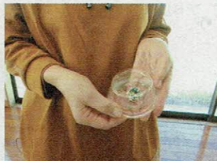
▲グルーデコブローチ作り