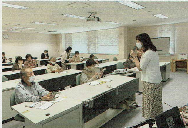
▲デジタル化に向けて一つひとつ前進