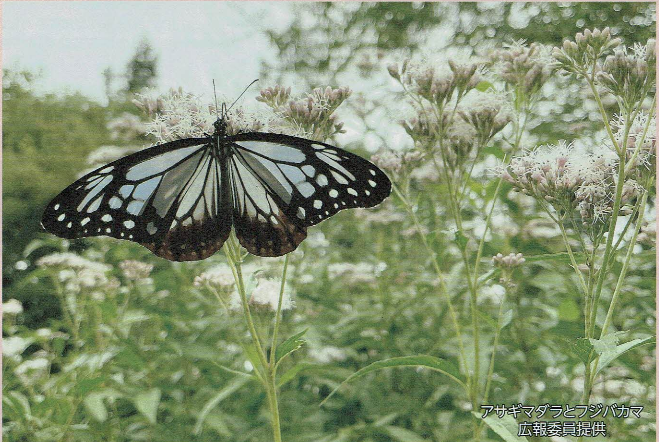
アサギマダラとフジバカマ

アドレス https://www.sjc.ne.jp/kosyoku/ E-mail kosyoku@sjc.ne.jp