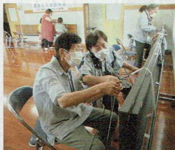
▲パラコードを使ったリード作り