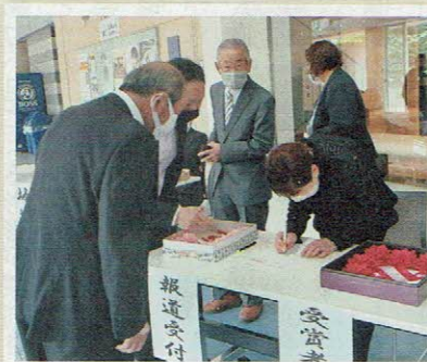
▲笑顔で受付。胸元にリボンを