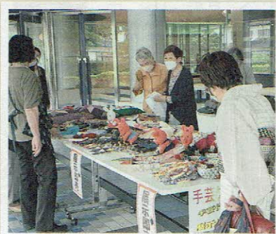
▲カラフルな作品が並ぶ展示即売

総会では、ロビーにおいて恒例の手芸の会による作品展示即売も行われ、来場者が興味深く見入っていました。