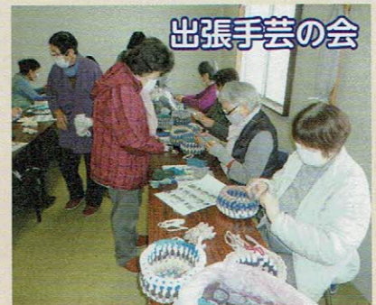
戸倉上山田支所で初めての開催 熱心に指導する会員たち