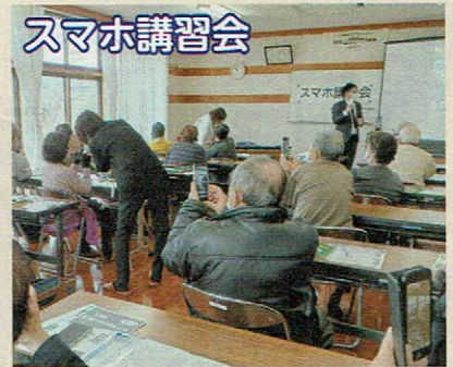
使いこなせないスマホも講師に教えてもらい習得できました