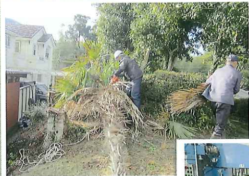
しよろの木伐採作業