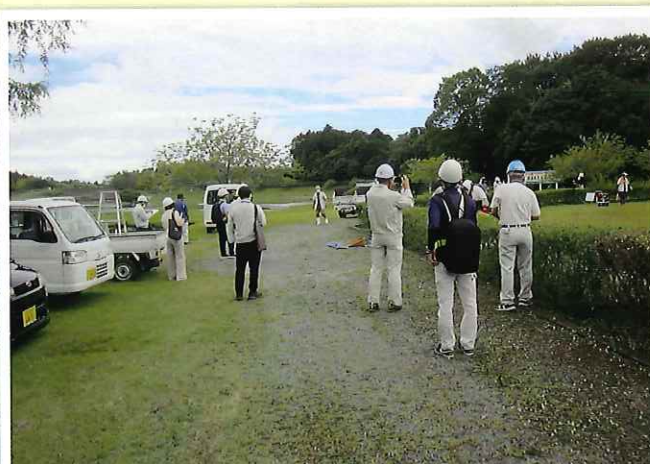
県内安全委員による作業の安全パトロール