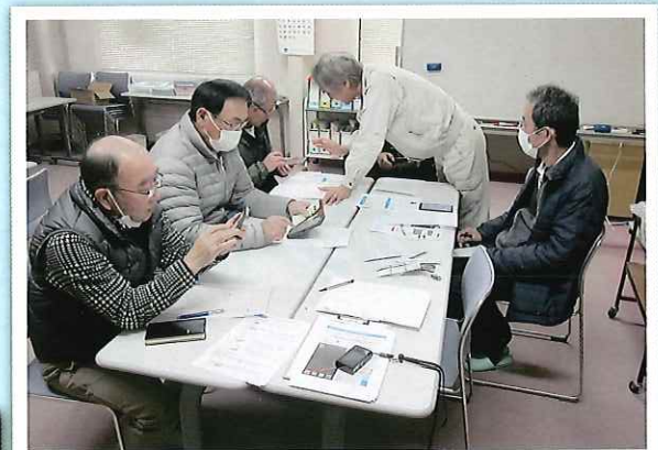
会員専用アプリスマスマ登録会