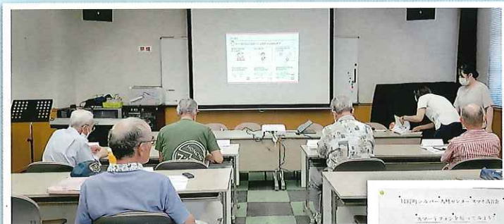
ドコモショップのスマホ講習