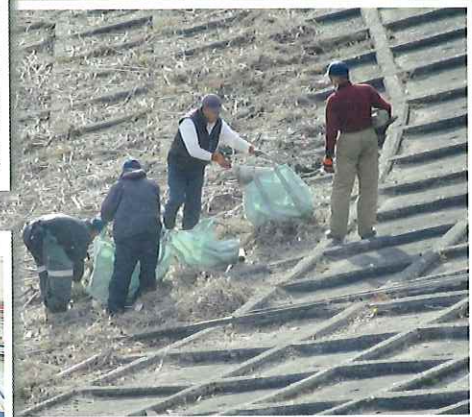
日野川ダム流木拾い