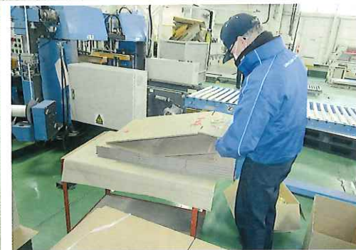
ダンボールの持ち手つけ