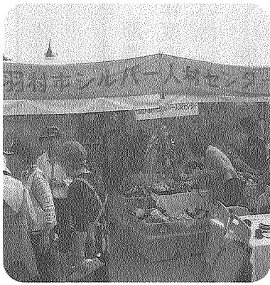
(テント前は大盛況!)

テント内ではセンターが募集している仕事の紹介や、賞状・宛名書き等の毛筆筆耕、パソコンでの年賀状作成の案内、家事援助・育児支援サービスの紹介