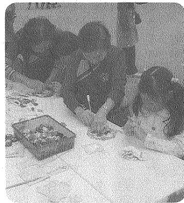
(鍋敷き作りの実演)