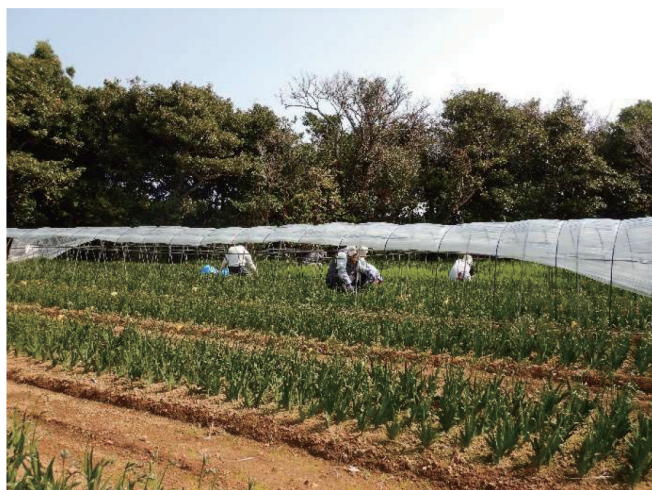
フリーズア畑除草

※これまでご対応できなかった発注者様からの指揮命令を受ける作業が、派遣事業として可能となりました。詳しくは事務局へお問い合わせください。