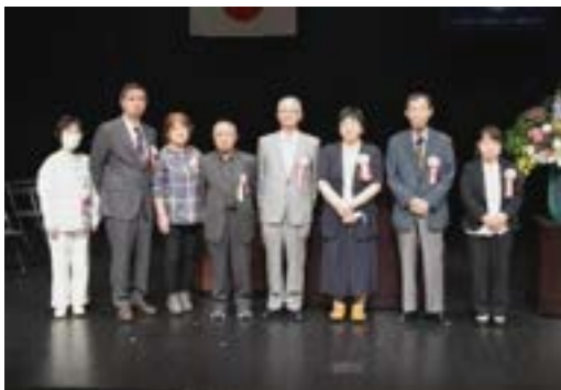
▲出席された顕彰者の皆さん