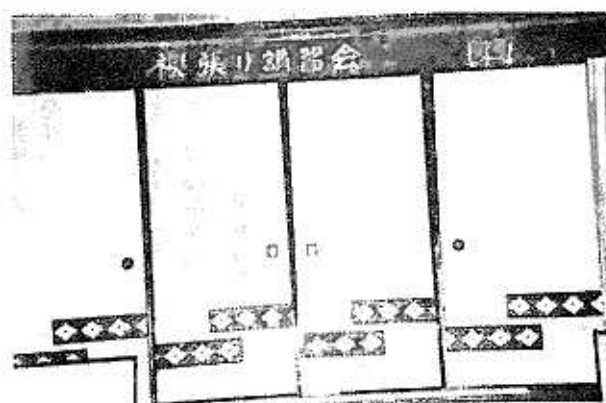
【講習会二日目の作品】

まずは技術の習得、二日間に亘る講習会を経て、実際の作業に入っています。二日目の作品がこの写真です、少しは胸を張りたい出来ばえでしょ。講師にホメられました。