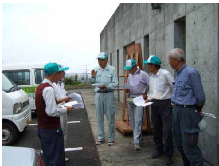
安全管理委員会による巡回パトロール、ミーティングにも力が入ります。

安全管理委員会の本年度の目標として、災害を1件でも減少させるべくできるかぎり作業現場の巡回をいたします。