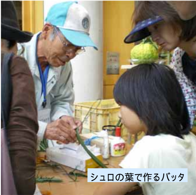
シュロの葉で作るバッタ