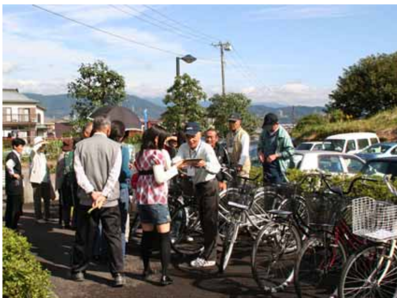
リサイクル自転車の販売は、まるでジャンケン大会！わずか20分で完売しました。

「この時期、野菜は少ないから・・・」と言っていた、はればれ市グループの会員の皆さんでしたが、テントに入りきれないほどのたくさんの野菜や果物が並びました。