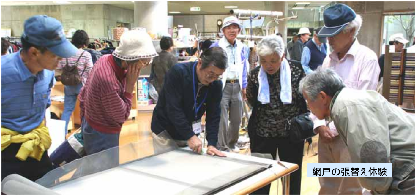
網戸の張替え体験