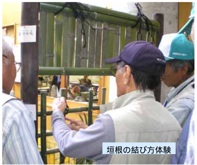
垣根の結び方体験

シルバー会員の技と知恵が、たくさんのお客様を迎えました。 （なんと、早くも来年に向けてのアイデアが?!……）