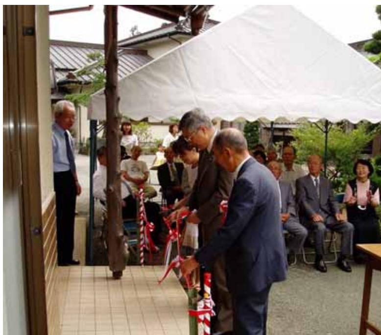
開所式でのテープカット

理事長の開所宣言が、弘済寺の森にひびき、列席者の笑顔、又子ども達の高らかな清き声、関係者と児童の心の交流がひしひし感じました。