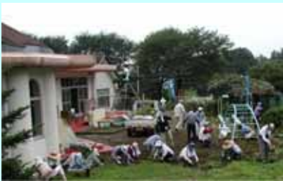
Page 6 昨年の奉仕活動は北幼稚園でした。