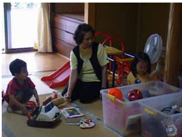
おもちゃや絵本は、すべてシルバー会員の寄付です。

一時預かり保育は、子育て支援コーディネーター(保育士等)と従事会員講習を受けた子育て経験豊富なシルバー会員で行います。