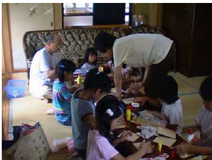
夏休み特別企画 造形教室「シルバー会員3人が先生に！」 夏っぽい、かわいい、和風フォトフレームを作りました。

〒250-0132 南足柄市弘西寺131 弘濟寺境内 電話/FAX 73 2960 ホームページ http://minamiashigara.hp.infoseek.co.jp/ba_ba_club.htm