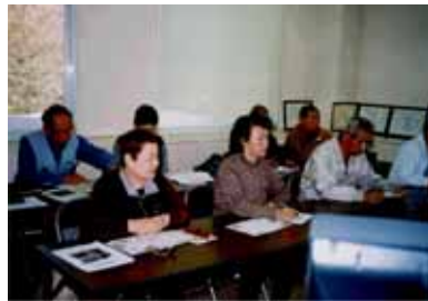
毎月開かれる入会説明会

「財政の安定」については、項目として会費収入の確保や事務費の増収があり、センター事業の計画的なPRによる受注拡大や賛助会員の強化などが掲げられています。